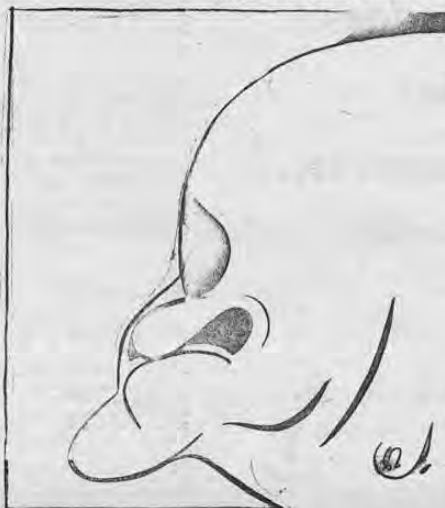
¡aquí, Colombia, estropeando...