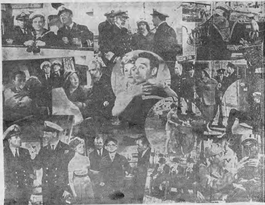
En este arreglo fotográfico exclusivo para "Pantalla y Escenario" vemos varias escenas de la película ciento por ciento cinematográfica "CUIDADO CON LA POPA" en la que trabajan los artistas Kenneth Connor, Eric Barker, Leslie Phillips, Joan Sims y otros más. Es una cinta "atómica"... "El Rastreador" es un torpedo

En el banco de una plaza están sentados el capitán, su primer oficial y Blissworth. Da divi, Blissworth repite una y otra vez: "¿Qué extraño...!"