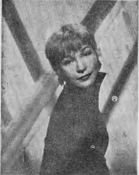
SHIRLEY MC LAINE, la actriz que ha estronizado una nueva era en el séptimo arte, actúa en CAN CAN, cinta que se convirtió en un fabuloso golpe publicitario en la URSS vuelve a lucir su incomparable gracia que le ha ganado el título de ser una de las más grandes comediantes de Hollywood.

Frank Sinatra, Maurice Chevalier, Louis Jourdan y Juliet Prowse integran, además de Shirley MacLaine, el sensacional reparto de esta grandiosa superproducción.