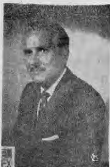
Arturo de Córdoba en "Peccado de Juventud" interpreta el papel de un abogado con singular amor y transparencia. Un abogado que pone sus conocimientos a disposición de los humildes.