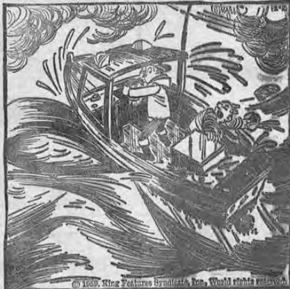
—La otra vez que me invites a dar un paseo en lancha, espero que no sea cuando haya comenzado ya los Nortes.