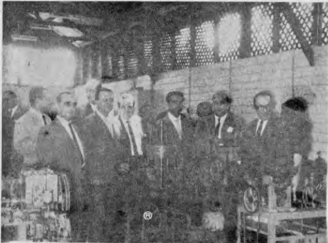
Muestra el graduado a un grupo de los asistentes al acto de inauguración de Industrias Metal-

ica Ltda. Entre ellos el Presidente Orlich, contemplando las instalaciones.