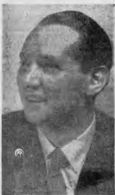
DANIEL DUNO, el destacado cantante de Ópera Italiana, que en compañía de los también artistas Lagares y Quesada, presentará en San José, una breve temporada de ópera en el Teatro Nacional...

a Daniel Duno, y juntos anuda mos algunos recuerdos de la maravillosa isla.